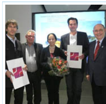
Architekturpreisübergabe mit Präses Nikolaus Schneider (r.) für den Ratinger Glockenturm.

Das Glockenhaus steht "mitten im Leben", ist präsent im Stadtraum, betonte Kirchenrat Kai Krischnak für die Wilhelm-Schrader-Stiftung bei der Preisübergabe. "Ein kleiner Kubatur mit großer Wirkung."